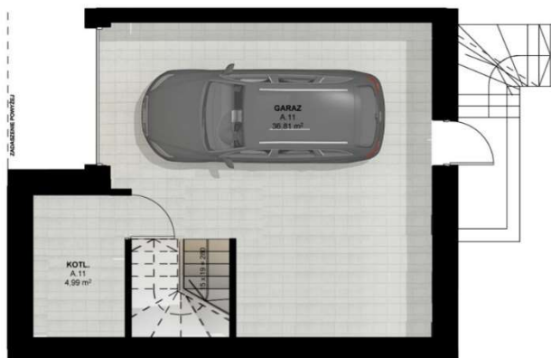
RZUT PIWNICY skala 1:100