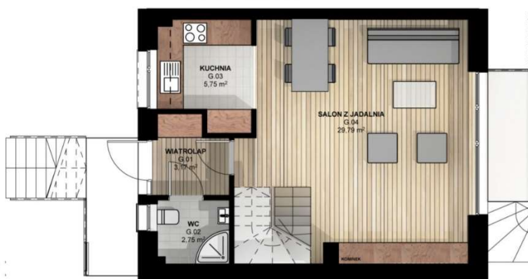
RZUT PARTERU skala 1:100