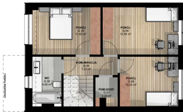
RZUT PODDASZA skala 1:100