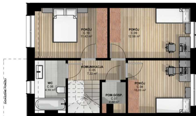
RZUT PODDASZA skala 1:100