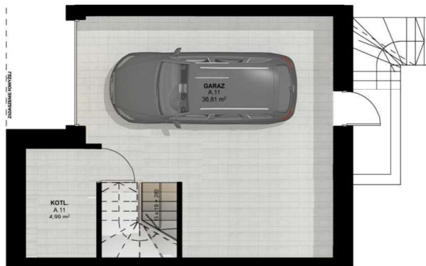
RZUT PIWNICY skala 1:100