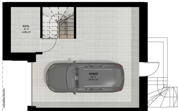
RZUT PIWNICY skala 1:100