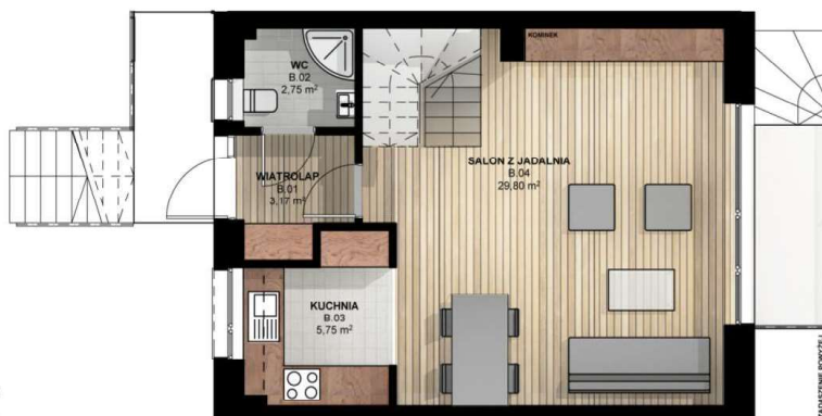
RZUT PARTERU skala 1:100