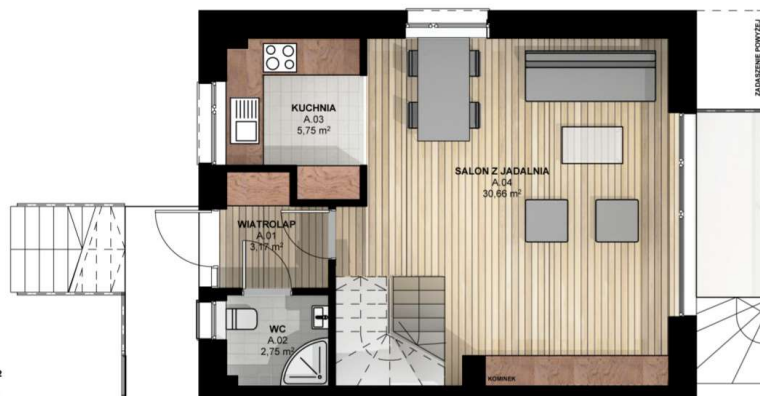
RZUT PARTERU skala 1:100