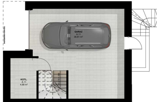
RZUT PIWNICY skala 1:100