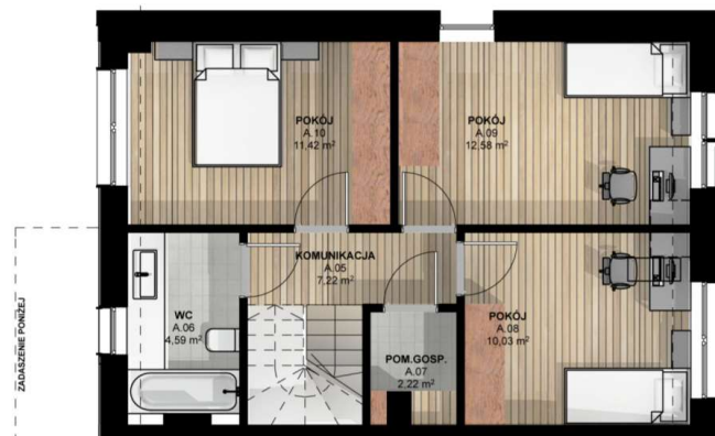
RZUT PODDASZA skala 1:100